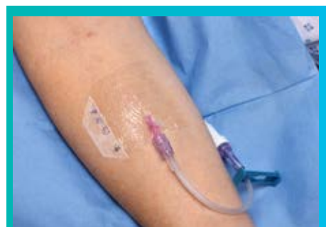
3. Překryjte I.V. vstup

Vyžádejte si pro Vaši nemocnici osobní prezentaci produktu, nebo možnost jeho vyzkoušení.