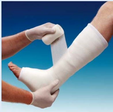
Nosná tkanina se dokonale přizpůsobí i v problematických místech.

Pletená polyesterová tkanina se velice dobře přizpůsobuje tvarům těla. Během aplikování ji lze napínat a díky jedinečným charakteristikám příčných vláken s nízkou tvarovou pamětí si uchovává nový tvar. Proto se fixační obvaz 3M™ Scotchcast™ Poly Plus snadno používá a dobře se přizpůsobuje i obtížným konturám těla.