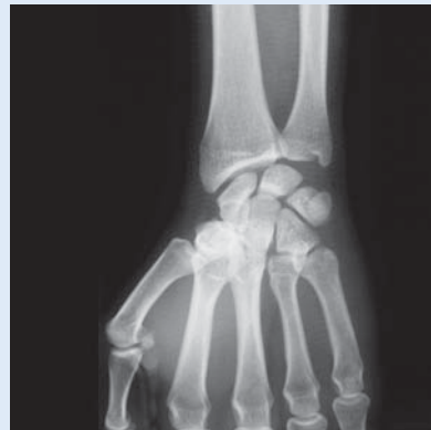
Výborná propustnost rentgenového záření.